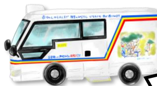
図書館バス (2週間ごと巡回)

個人 10冊・2週間 (次の巡回日まで) 団体 200冊・2週間 (次の巡回日まで)